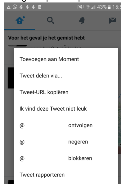
Op je telefoon ziet dit er zo uit.